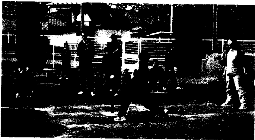
▲ ティーボールは止まっているボールを打つ競技です・・・11月