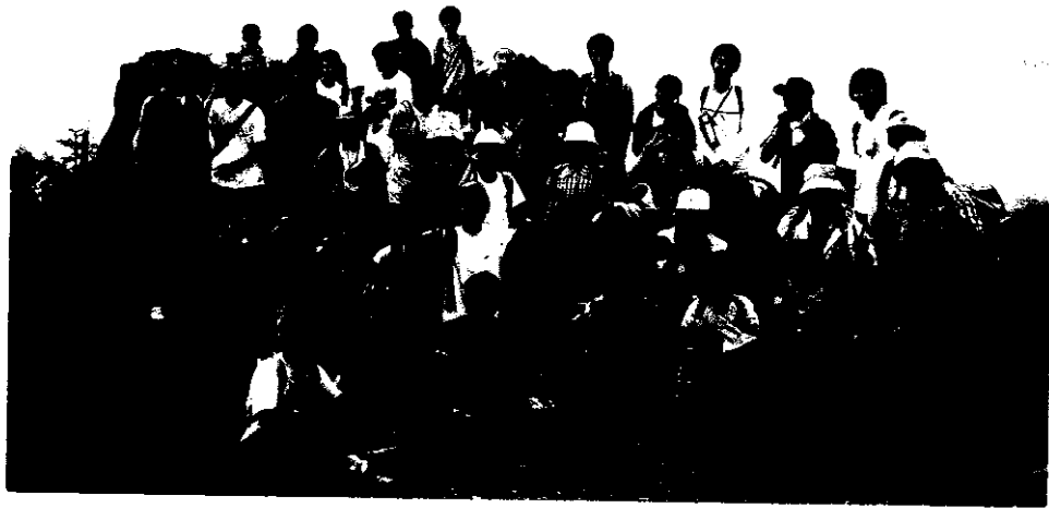
▲八幡平茶臼岳山頂にて…7月