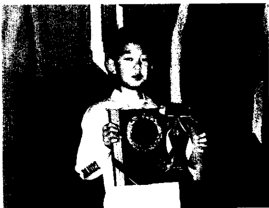
▲ 日本消防会館ニッショーホールにて「優良な少年消防クラブ」の盾を頂く

これからも、防災活動の他にもいろいろな地域活動に積極的に取り組み、貢献しようと呼びかけられています。