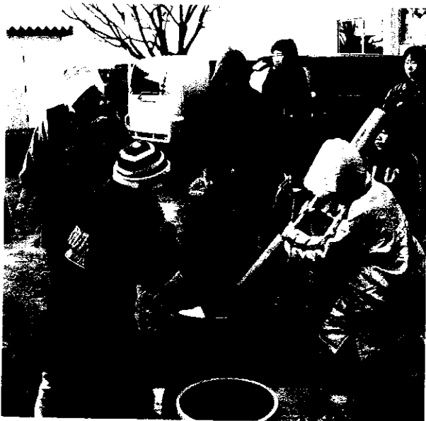
▲呼吸を合わせて「ペッタンコ」・・・12月

一番うれしかったことは、自分のついたお餅をすぐにあんこ、きな粉などにまぶしたり、お雑煮にして食べれたことで、良い思い出となりました。