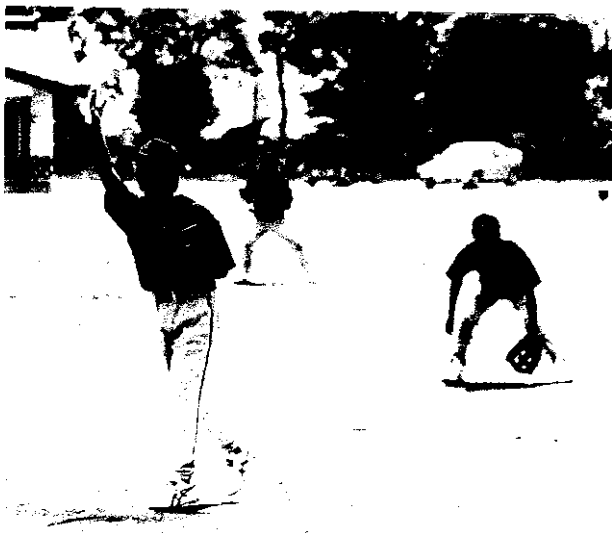
▲チームワークよく見事優勝…8月