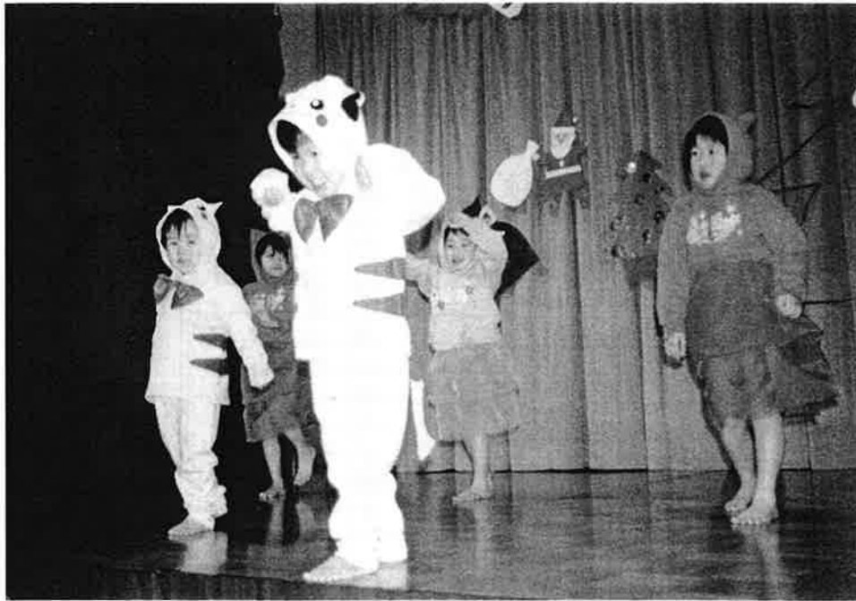
とても上手に踊れましたね「ねこのタンゴ」