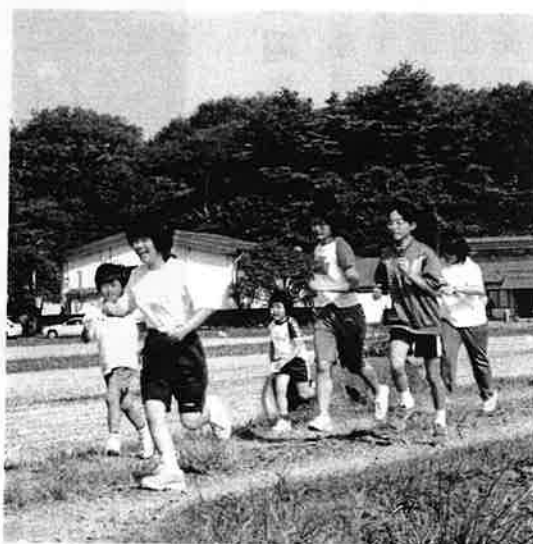
▲ スポーツ大会 (マラソンの部)